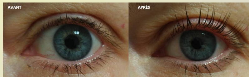
CILS EN BATAILLE

Ce procédé permet de gagner du temps le matin, car il rend inutile l'étape du recourbe-cil : la courbure tient en moyenne 4 à 5 semaines.